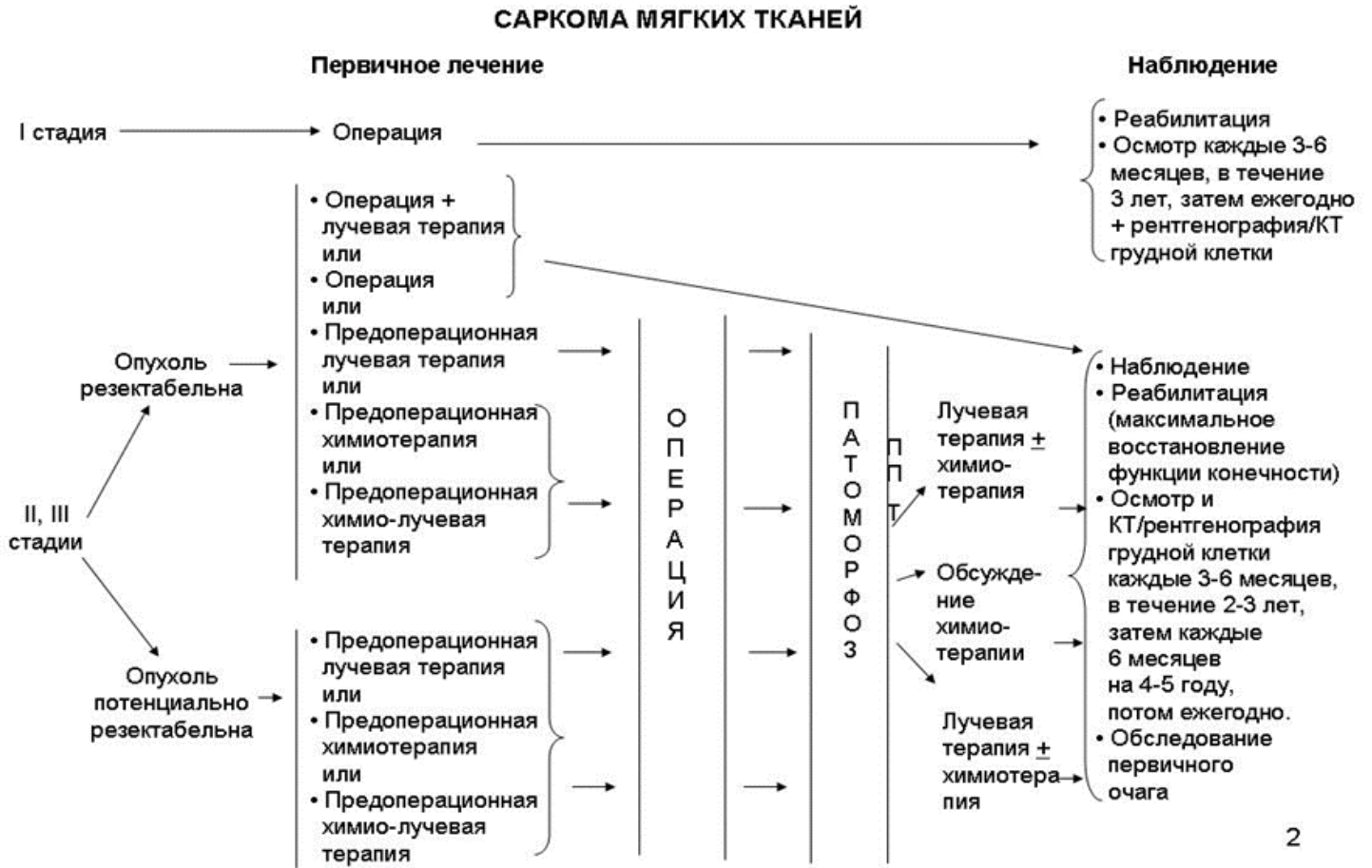
Схема 1. Блок-схема диагностики и лечения пациентов с саркомами мягких тканей